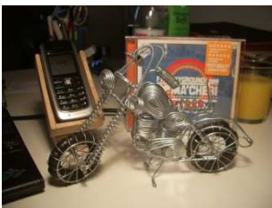
SCHON EINMAL IRGENDWO GESEHEN? SOLL VORKOMMEN!

Die darauffolgenden Tage habe ich mich dann, ausgerüstet mit Standardantworten auf Standardfragen, daran gemacht, alte Freunde wieder zu treffen. Es war manchmal schon komisch, sich wieder zu sehen, aber im Großen und Ganzen verlief es einfacher und unspektakulärer als ich erwartet hatte.